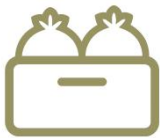
Taze Tarımsal Ürün

Dijital altyapı üzerine kurulu bir tarımsal tedarik zinciri modeliyle faaliyet gösteren Konfrut, iştirakleri ile birlikte koordineli şekilde çalışarak tarım ve gıda endüstrisinin ihtiyaçları doğrultusunda dört ana iş birimi kapsamında faaliyet gösteriyor: